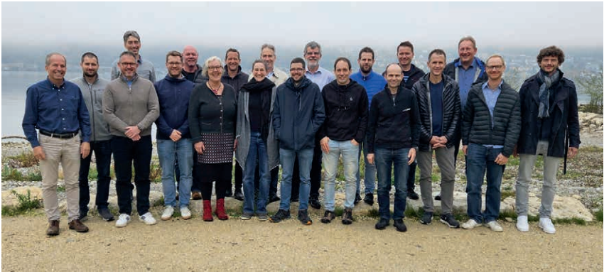
Bild 1: Mitglieder der AG Seen beim Treffen am 06.11.2024 in Biel/Bienne

Die Gruppe erfreut sich weiterhin grosser Beliebtheit und profitiert fortlaufend von den aktiven Beiträgen der Mitglieder.